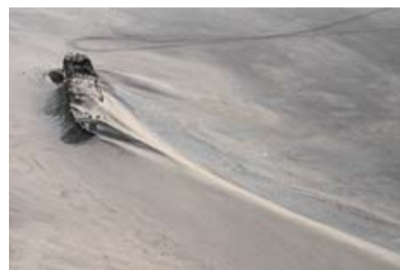
Корабль Eduard Bohlen