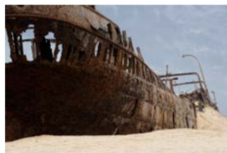
Корабль Eduard Bohlen