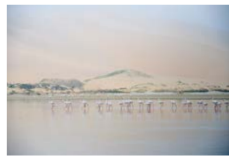
Заповедник Sandwich Harbor