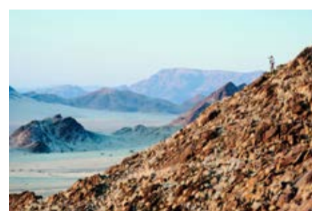
Долина реки Кунене