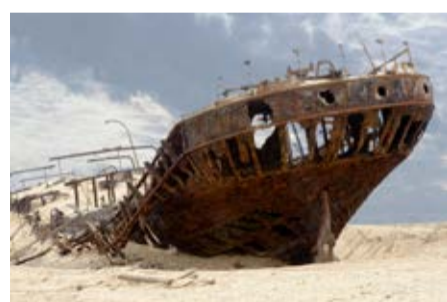
Корабль Eduard Bohlen