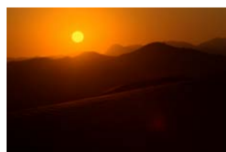
Долина реки Кунене