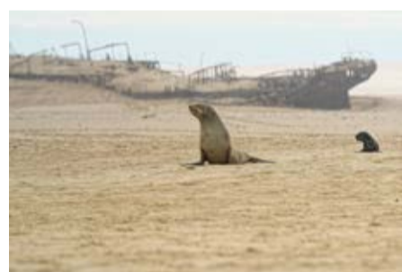
Корабль Eduard Bohlen