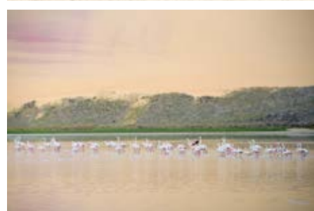
Заповедник Sandwich Harbor