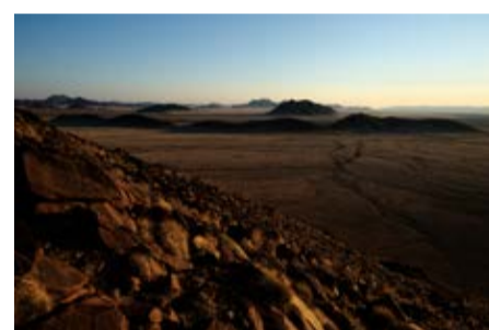
Долина реки Кунене